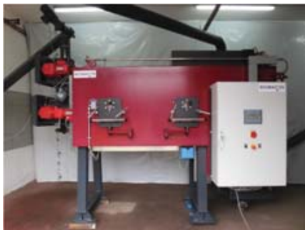
Die neuen BIOMACON-Kompaktconverter sind noch leistungsstärker, produzieren noch reinere Pflanzenkohle und sind noch leiser (42dB)

Pflanzenkohle ist ein wichtiges Instrument im Kampf gegen den Klimawandel. Ein Kilogramm reine Pflanzenkohle bindet 3,6kg CO 2 für mehr als 1000 Jahre. Außerdem ist Pflanzenkohle ein starkes Werkzeug gegen die Desertifikation der Böden. Gewässer und Grundwasser werden aktiv geschützt, wenn nitrathaltige Düngemittel durch Pflanzenkohle ersetzt werden.