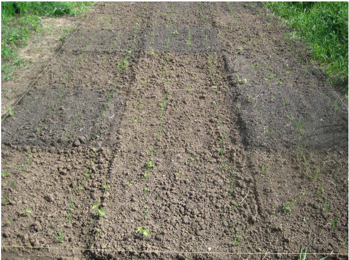
Abb. 2: Versuchsfläche 13 Tage später, wenige Wochen später sind alle Karotten vollständig verschwunden (Schneckenfrass).